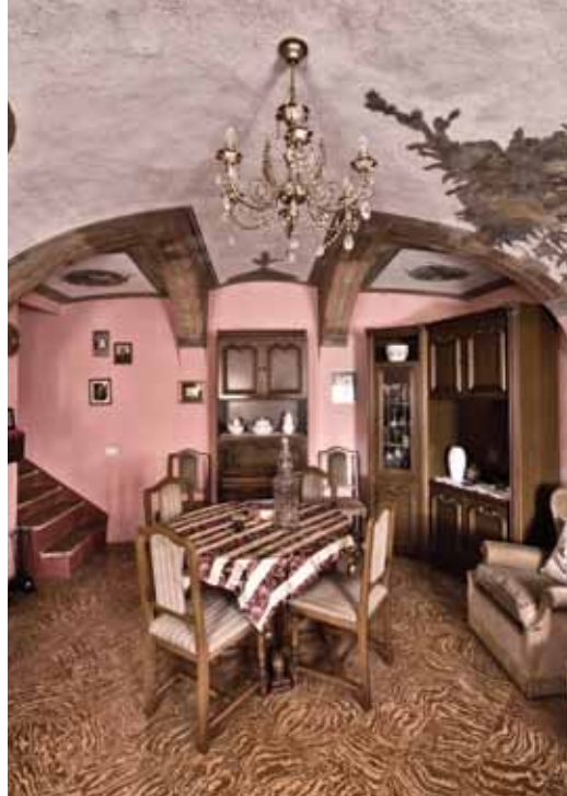
Cella Monte, fraz. Coppi

I soffitti dipinti, sono indubbiamente, nella decorazione degli interni una non facile sfida per i pittori (dove il termine “pittore” indica l'artista e l'imbianchino) il più delle volte costretti a lavorare in condizioni non sempre agevoli, come ricorda Mario Surbone.