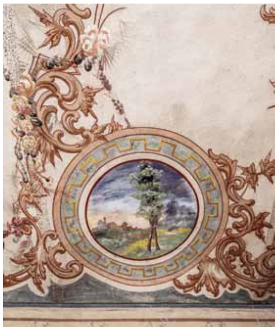
Nella pagina precedente: Cella Monte. In questa pagina: dall'alto verso il basso in senso orario Sala Monferrato, Cella Monte, Ottiglio e Cella Monte.