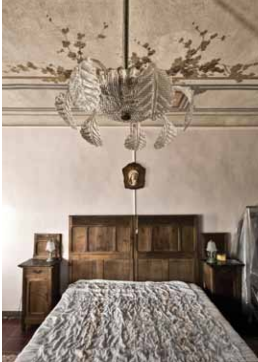
Rosignano Monferrato, fraz. Colma