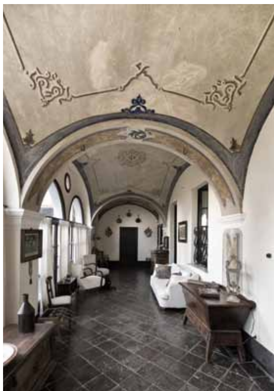
Rosignano Monferrato, loc. Castagnoni