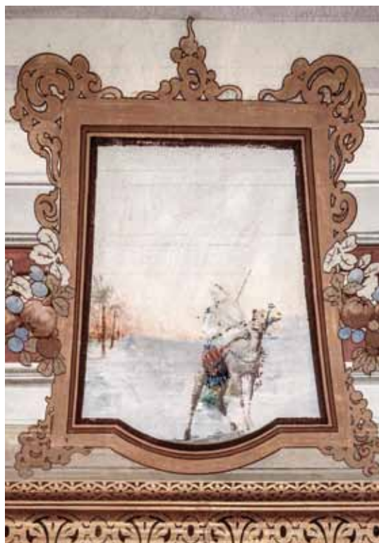
Nella pagina precedente: Ozzano Monferrato, Cella Monte. In questa pagina: dall'alto verso il basso in senso orario Cella Monte, Rosignano Monferrato, Cella Monte e Ozzano Monferrato.