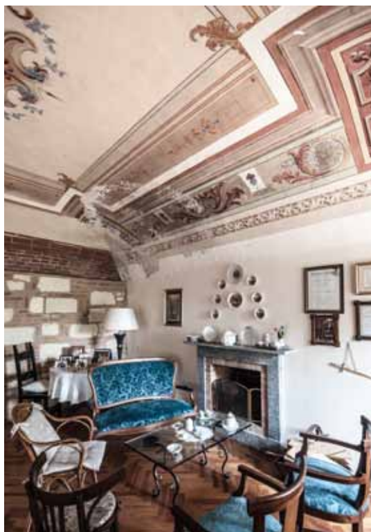
Cella Monte, loc. Groppo

Allo stesso modo oggi appare indispensabile e meritorio questo volume, preziosa testimonianza fotografica in grado di censire e far emergere, seppure in modo ancora non esaustivo, uno dei tanti patrimoni nascosti di questo territorio, altrimenti destinato a rimanere privato e pressoché sconosciuto. E nell'ottica certamente urgente della conservazione e della trasmissione al futuro di una così ricca eredità culturale, pubblicazioni come queste si rivelano indispensabili strumenti di supporto per gli enti che di tale tutela sono chiamati quotidianamente a farsi carico.